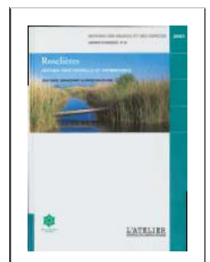
Figure n°73 : Couverture du guide « gestion et suivi des roselières » de RNF

Selon les thèmes abordés, le gestionnaire pourra aussi envisager de communiquer les résultats d'une étude au cours du Forum des gestionnaires organisé chaque année par les réseaux d'espaces naturels, par le biais d'une présentation orale ou d'un poster.