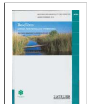
Figure n°73 : Couverture du guide « gestion et suivi des roselières » de RNF