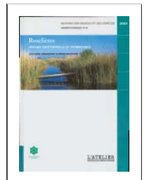
Figure n°73 : Couverture du guide « gestion et suivi des roselières » de RNF

Selon les thèmes abordés, le gestionnaire pourra aussi envisager de communiquer les résultats d'une étude au cours du Forum des gestionnaires organisé chaque année par les réseaux d'espaces naturels, par le biais d'une présentation orale ou d'un poster.