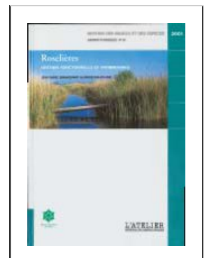
Figure n°73 : Couverture du guide « gestion et suivi des roselières » de RNF

Selon les thèmes abordés, le gestionnaire pourra aussi envisager de communiquer les résultats d'une étude au cours du Forum des gestionnaires organisé chaque année par les réseaux d'espaces naturels, par le biais d'une présentation orale ou d'un poster.