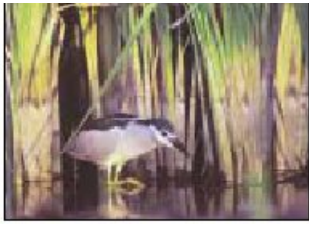
Figure n°74 : Couverture du 2ème numéro de "Espaces Naturels"