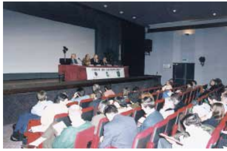
Photo n°58 : Le forum des gestionnaires est l'occasion de rassembler tous les ans les acteurs des espaces naturels.